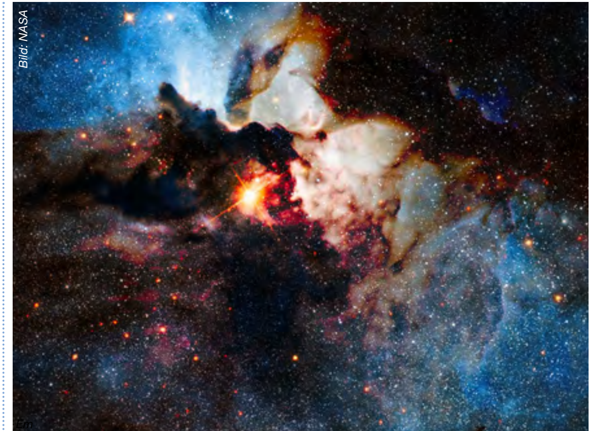
Sternennebel in der Tiefe des Weltraums, viele Lichtjahre entfernt von unserem Planeten.

Beilage der Zeitung «reformiert» ZH 1699 Nr. 17 / 16. September 2022