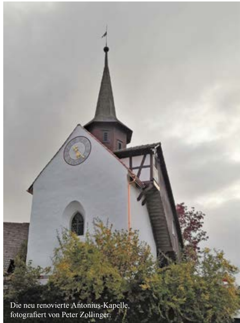
Die neu renovierte Antonius-Kapelle