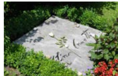
Der Friedhof Fluntern beheimatet - unter vielen anderen - auch Gräber von berühmten Persönlichkeiten, welche eine Zeit ihres Lebens in Zürich verbracht haben.