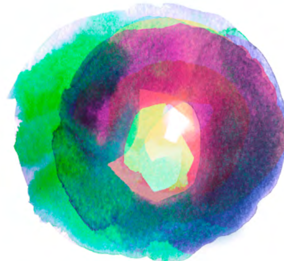
Bei der Aquarellmalerei schimmern die unteren Farben durch die oberen hindurch, dabei entstehen neue Töne.