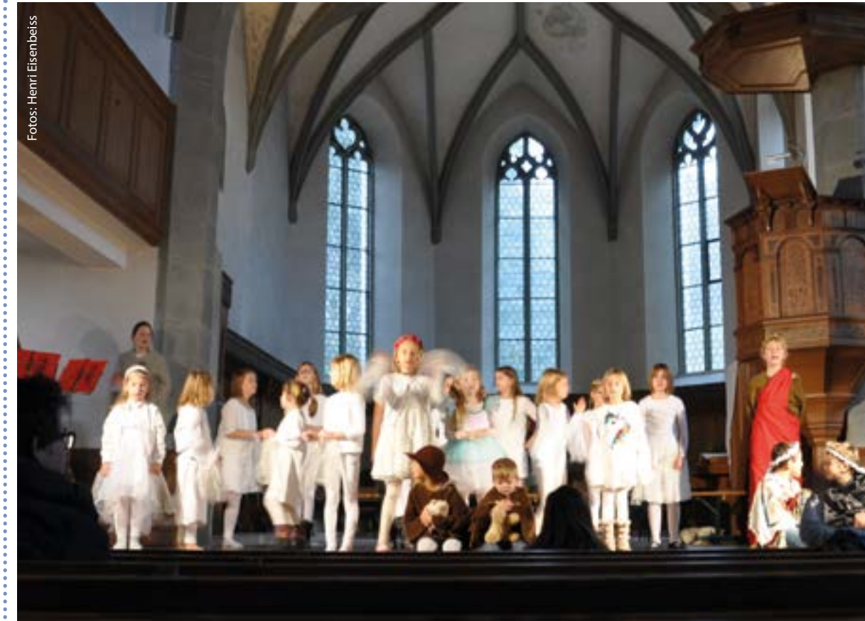
Eine grosse Engelschar war am 16. Dezember in unserer Kirche gelandet.....