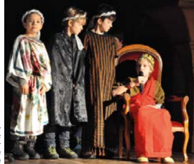
Oben: König Herodes unten: seine aufgeregten Kammerzofen