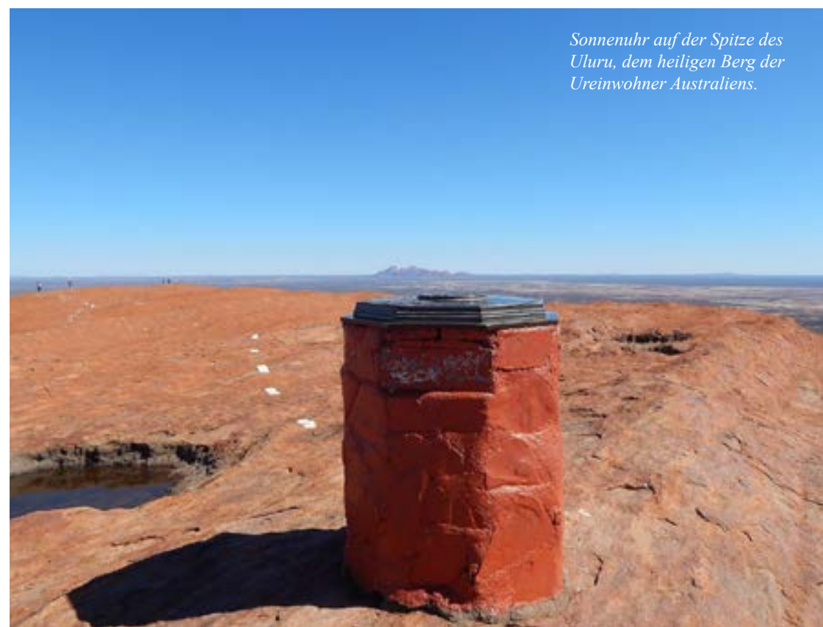
Sonnenuhr auf der Spitze des Uluru, dem heiligen Berg der Ureinwohner Australiens.

verschiedenen Mythologien eine große Rolle, etwa bei Helios' „Sonnenwagen“ der griechischen Antike und in der Deutung von Sonnenauf- und untergang. Die in den gemä-