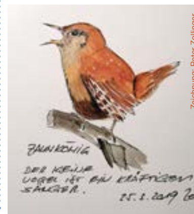
Zeichnung: Peter Zollinger

Kleinkindergottesdienst für Kinder ab ca. 3 Jahren. Geschwister, jünger oder älter sind willkommen.