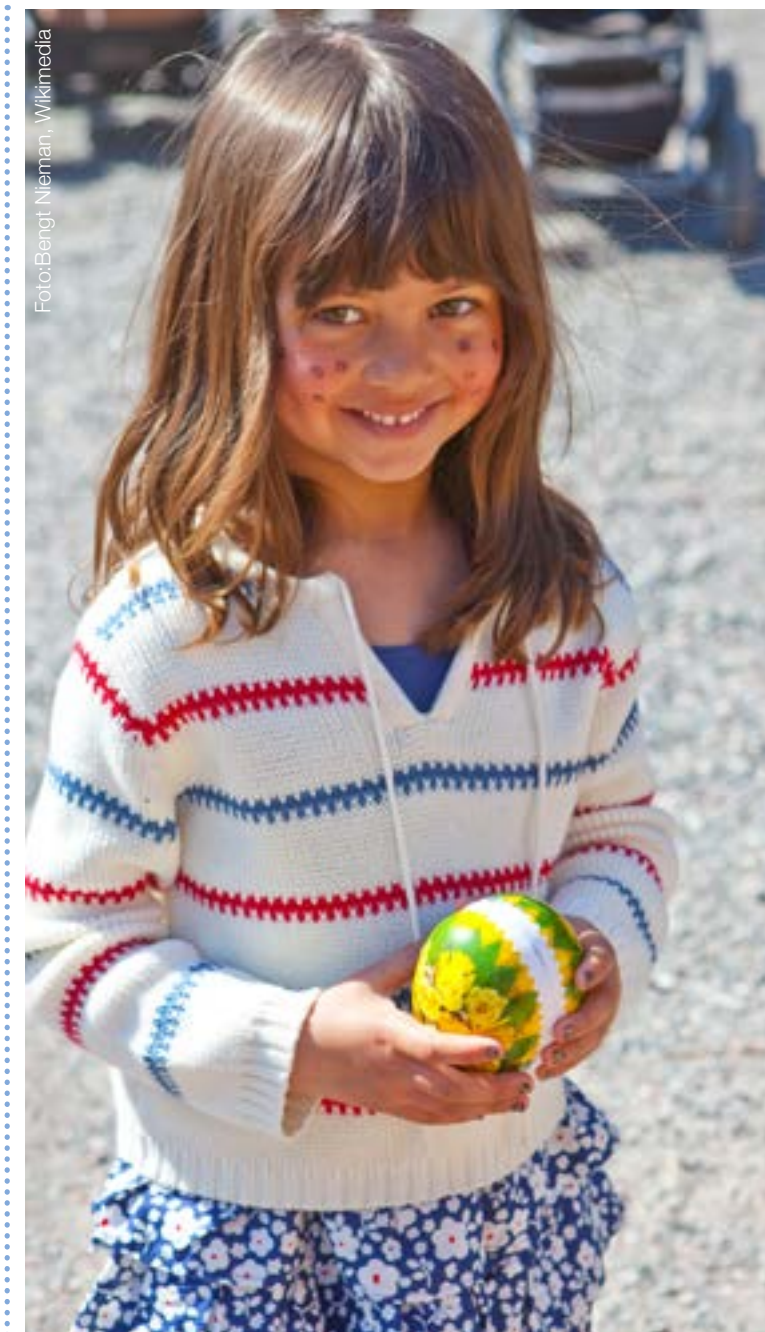
Ein Mädchen freut sich über die Ostersonne und die Geschenke.

Karfreitag und Ostern, das sind die beiden höchsten Feiertage der Christinnen und Christen. Nur zwei Nächte voneinander entfernt, bringen sie die Spannung zum Ausdruck, in der wir unser Leben zu leben haben. Die Spannung von Schwerem und Leichtem, von Ernstem und Fröhlichem, von Trauer und Trost. „Ich bin vergnügt, erlöst, befreit“, so beginnt der Kabarettist und Schriftsteller, Liedermacher und Schauspieler Hanns Dieter Hüschi (1925-2005) seine freie Übertragung von Psalm 126, die für mich – auf dem Hintergrund des Karfreitags – wunderbar zu Ostern passt.