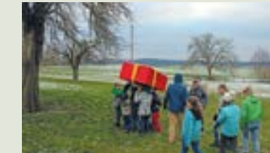
Nach dem Spiel auf der Wiese gab es heissen Punsch und „Cevihörnli“.