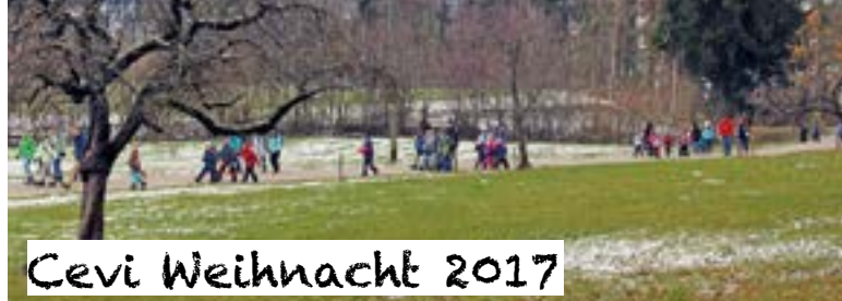
Die Kinder auf dem Marsch zum „Cevi-Hüsli auf St. Anna