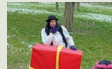
Es wurde eine Geschichte nachgespielt, in der Geschenkpakete eine wichtige Rolle innehalten.....